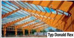
Typ Donald Rex

Typen o. angepasst mit Dacheindeckung + Rinnenanlage, prüffähiger Statik, mit + ohne Montage. Absolut preiswert! Reithallentypen 20 / 40 m + 20 / 60 m besonders preiswert! *1000-fach bewährt, montagefreundlich, feuerhemmend F-30B Timmermann GmbH – Hallenbau & Holzleimbau 59174 Kamen | Tel. 02307-941940 | Fax 02307-40308 www.hallenbau-timmermann.de | E-Mail: info@hallenbau-timmermann.de