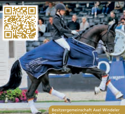
Besamergemeinschaft Axel Windeler Pferdezüchtung und Gut Lonken, Bretel

Weltmeister 2017 in Ermelo Don Juan de Hus - Benetton Dream FRH - Warkant - Matcho AA - Wenzel