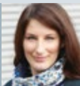
Juliane Kruse Redaktion, PHS- und Deckanzeigen