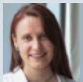
Kirsten Tilgner Grafik