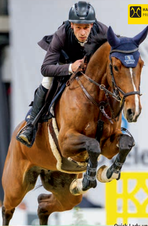
Quick Lady und Sebastian Elias

HANNOVERANER PROGRAMM HANNOVERANER SPRINGPFERDEZUCHT