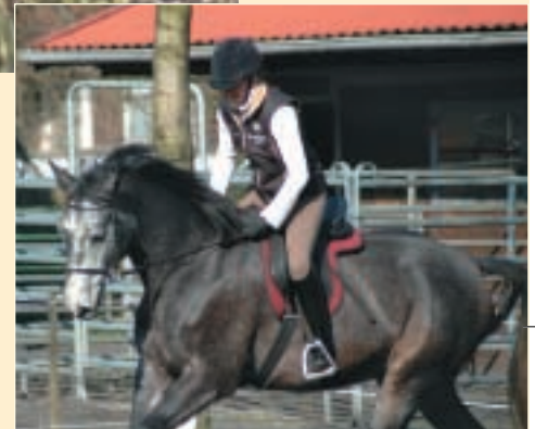
Aufgestiegen wird in Reken immer von einem Hocker (li.), anfangs brauchen die Pferde noch die äußere Begrenzung (2.v.li.) , doch wenig später geht es dann schon frei in die Bahn (3.v.li.) und dann folgt der erste Galopp im leichten Sitz (r.).

die äußere und innere Begrenzung hat die Remonte nur ein beschränktes Platzangebot. Man kann das Pferd geradeaus oder auf dem Zirkel reiten, auch ein Aus-dem-Zirkel-wechseln ist möglich. Das Pferd kann aber nicht so wegspringen wie in einer großen Halle, wo es nur eine seitliche Anlehnung gibt.